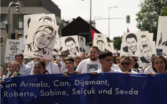
Foto von der Gedenkveranstaltung 2023

Am 22. Juli 2016 wurden am Olympia-Einkaufszentrum (OEZ) in München neun Menschen bei einem rechten, rassistischen und antiziganistischen Anschlag ermordet. Der Anschlag von München steht in einer Reihe mit den Anschlägen in Halle und Hanau sowie mit zahllosen weiteren rassistischen und antisemitischen Taten weltweit. Die Angehörigen der Opfer und die Überlebenden des Anschlags am OEZ mussten ähnliche Erfahrungen machen wie die Betroffenen anderer extremrechter, rassistischer und antisemitischer Verbrechen: Sie sahen sich konfrontiert mit gesellschaftlichem Desinteresse und der unzulänglichen Bereitschaft der Behörden, die Tat und ihre Hintergründe umfassend aufzuklären und als das zu benennen, was sie war: rechter Terror. Doch die Angehörigen und Überlebenden haben das Schweigen durchbrochen. Unermüdlich kämpfen sie seit dem Anschlag vom 22. Juli 2016 um Aufklärung und tragen ihre Forderungen nach Anerkennung, Erinnerung und Konsequenzen in die Öffentlichkeit. Sie haben erreicht, dass der Anschlag am OEZ mittlerweile als rechter Terror anerkannt ist.