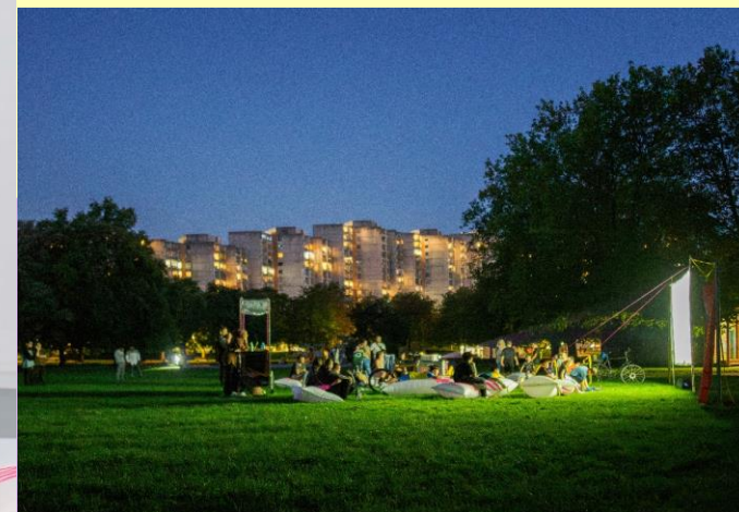
Ciné Vélo Cité: Kino Fahrrad Stadt (2023) Screening bei den ZAK Hütten (Wohnring, Neuperlach).