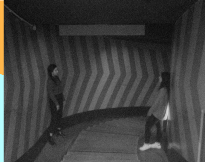
Filmstill | Super8 | 4:3 | b/w | 16 min

Denn wenn wir über strukturelle Gewalt sprechen, dann müssen wir die Opfer in den Vordergrund stellen statt sie wie ohnmächtige Statisten zu behandeln. Die Bildung solidarischer Beziehungen impliziert in ihrem Werk also immer die Akzentuierung der widerständigen Handlungsmacht betroffener Akteur*innen.