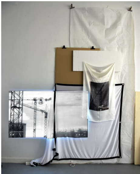
Stefanie Unruh, o.T. 2022 © VG Bild-Kunst

Druckfähiges Bildmaterial finden Sie zum kostenlosen Download unter www.plattform-muenchen.de/presse/