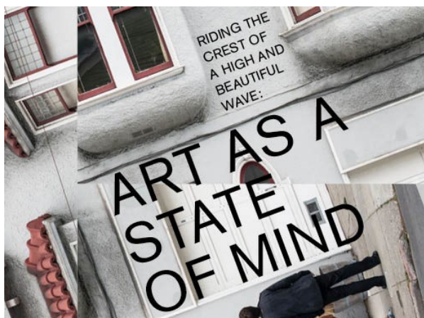
Grafik: studio MLLR