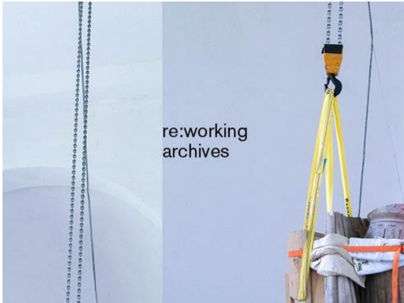
Grafik: Studio Mllr

Druckfähiges Bildmaterial finden Sie zum kostenlosen Download unter www.plattform-muenchen.de/presse/