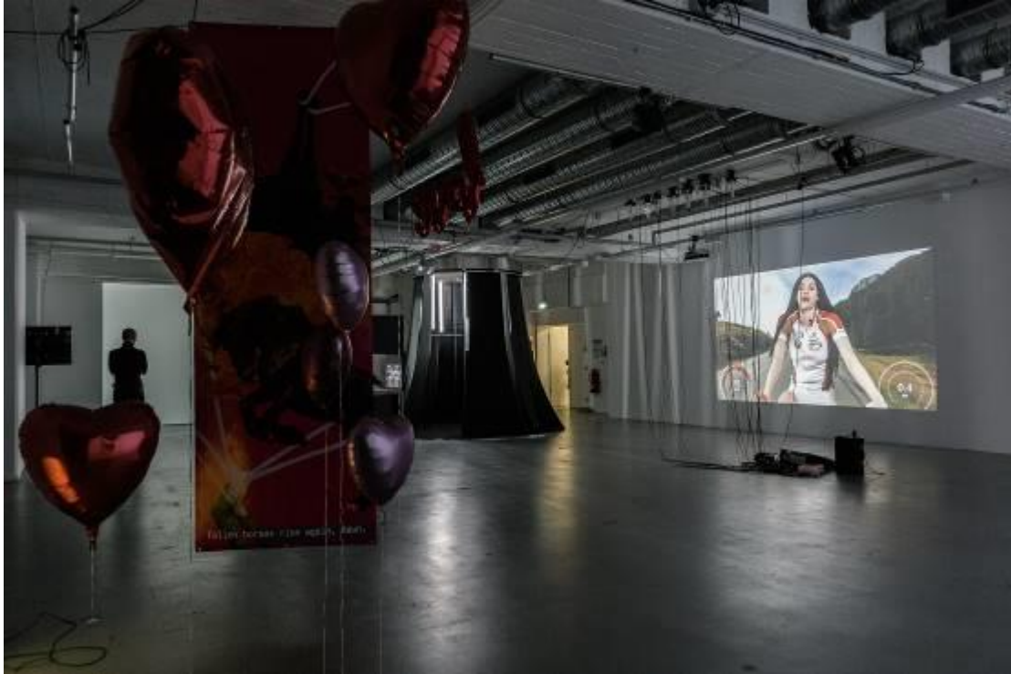
3Klasse Burger AdBK Nürnberg, Melkung Mittendrin, 2020