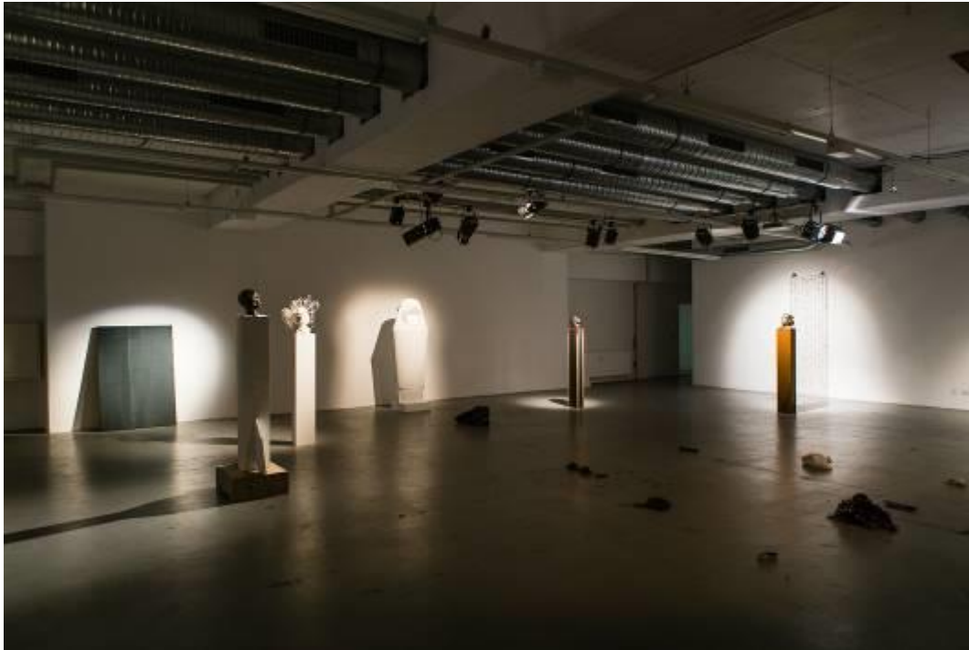
1 Phoebe Lesch, Zwischenspiel 2019