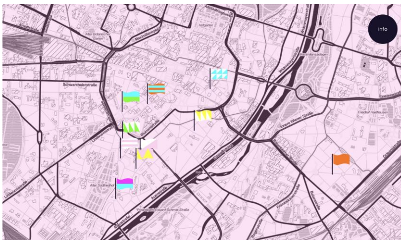
Abb.: Stadtkarte von gayze.de