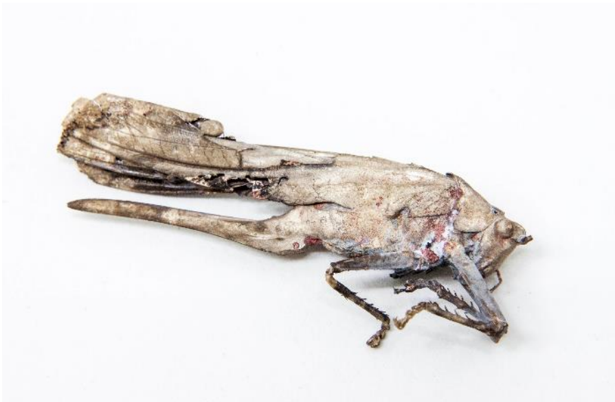
Lea Grebe, Grashüpfer, Bronze, 2017 © Lea Grebe.

Bildlegende Pressemitteilung vom 05.06.2018