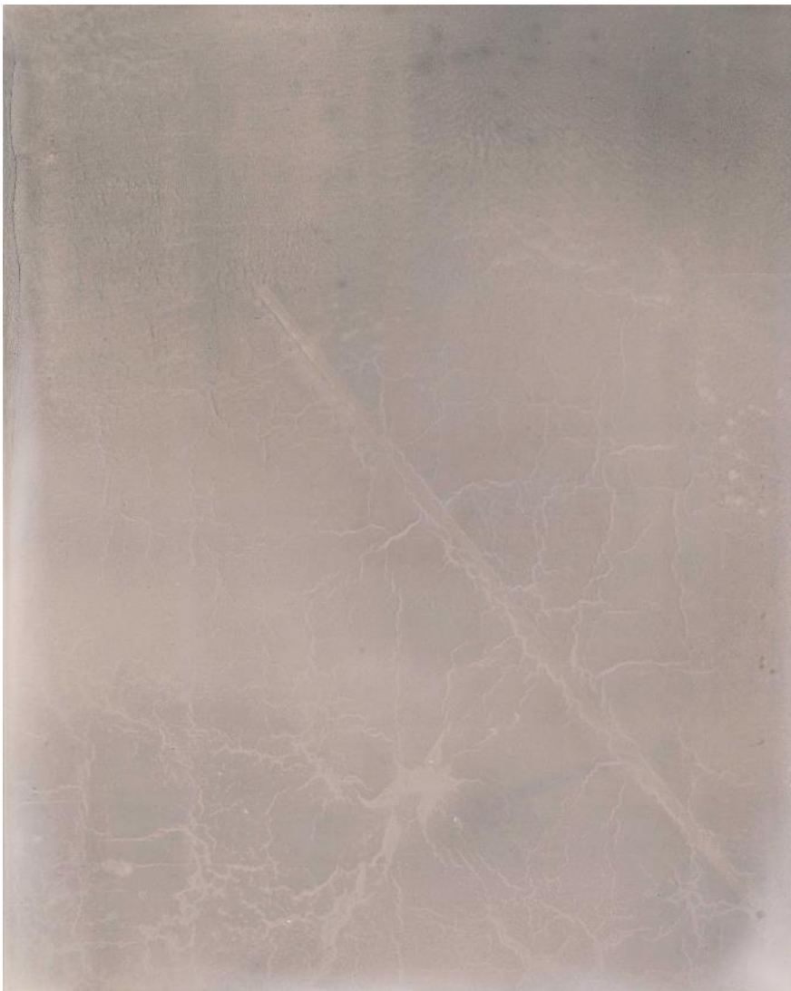
Andrea Zabriz, Ohne Titel, Serie Graphit Bilder IV © andreazabriz.com